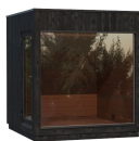
Kirami FinVision® -lounge M Misty, (Left) 1 deur