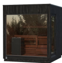
Kirami FinVision® -sauna M Misty (Right), Harvia Virta Combi 10,8 kW